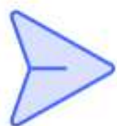
Схема рассмотрения обращений