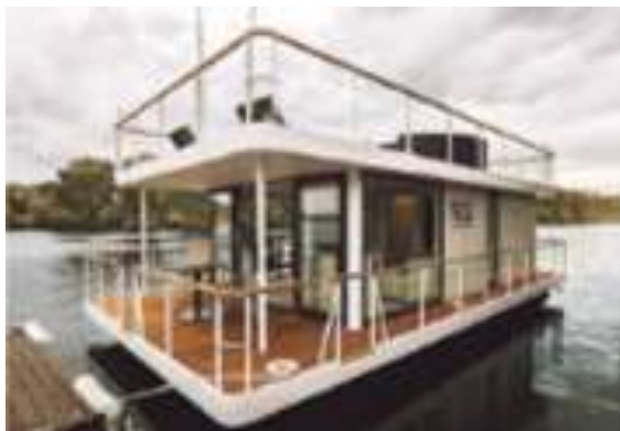
Хаусботы и сооружения на воде