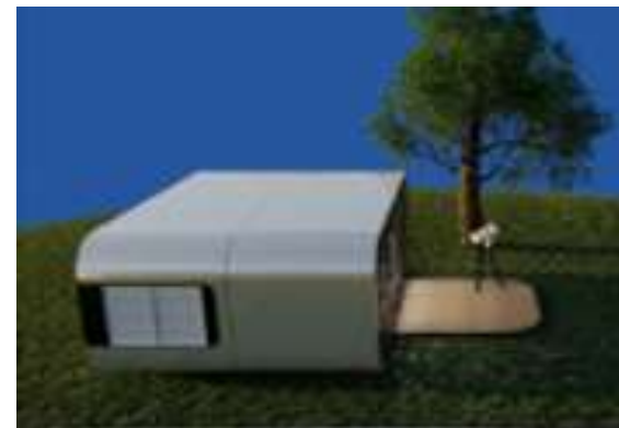
Сооружения для крайнего севера и экстремальных условий