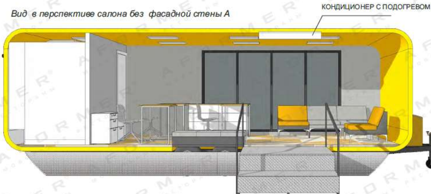
Вид в перспективе салона без фасадной стены А