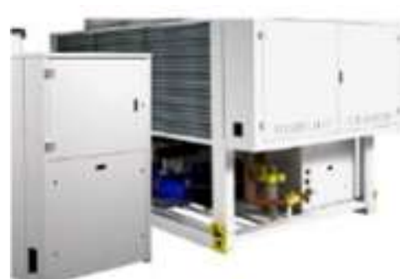
Холодильные системы хранения