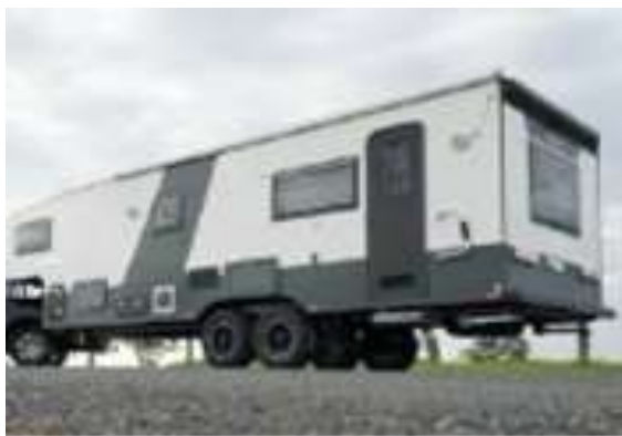
Изотермические и специальные фургоны и трейлеры