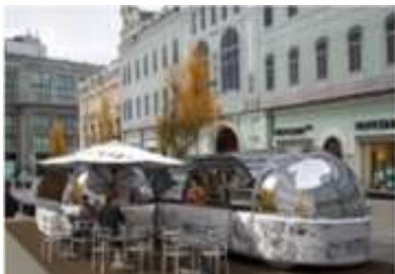
Фудтраки и мобильные коммерческие сооружения на шасси