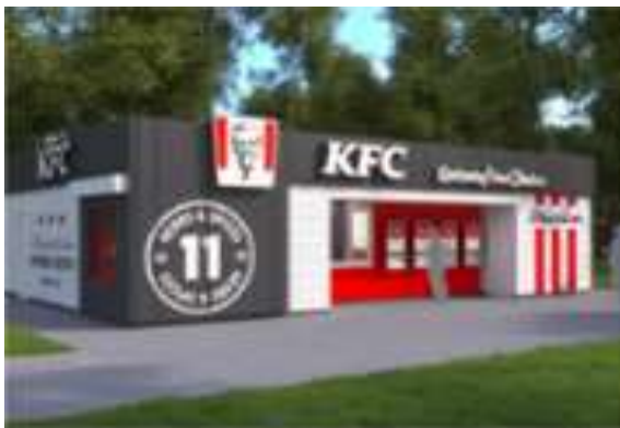
Коммерческие и жилые быстровозводимые модульные сооружения